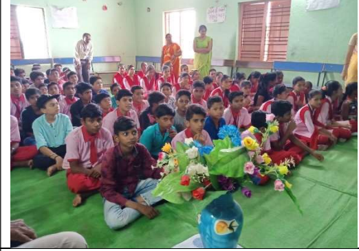
School: Monitor Club, Digras Students Present: 150

School: Dreamland Convent, Digras Students Present: 400