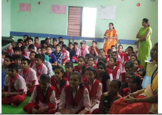
School: Monitor Club, Digras Students Present: 100